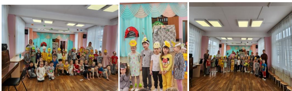
Спектакль 1 подготовительной группы. Кукольный театр на гапите.