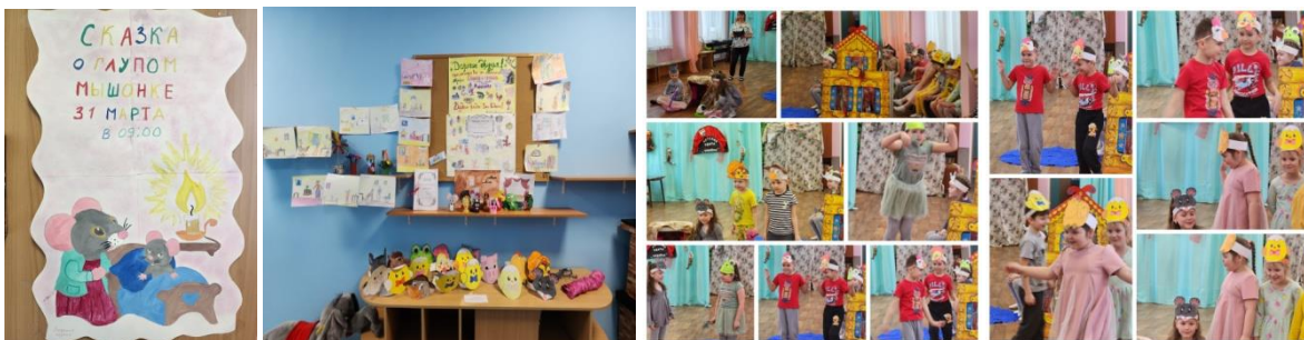
Театра – масок 3 старшей группы.